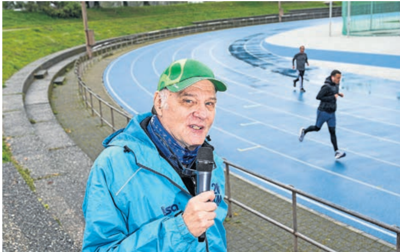
Christian Perler en connaît un rayon sur les 20KM et ses participants. PATRICK MARTIN